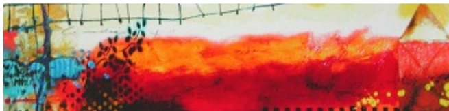
Mooie, kleurrijke zeefdruk van Theo Koster

En nog meer. Kijk op onze website onder Collectie en kies als filter Datum binnenkomst na: <vul bijv. in 01-12-2016>.