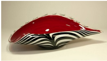
Fraai glaswerk van Loranto

Ook de afgelopen periode zijn weer de nodige nieuwe werken binnen gekomen.