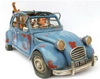
Neolith objecten met een knipoog van Forchino